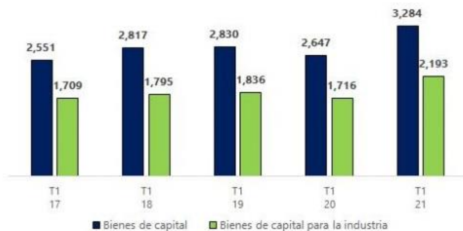
Gráfico N° 2 Perú: Importaciones de Bienes de Capital, Primer trimestre 2017 – 2021 (Millones de US$)