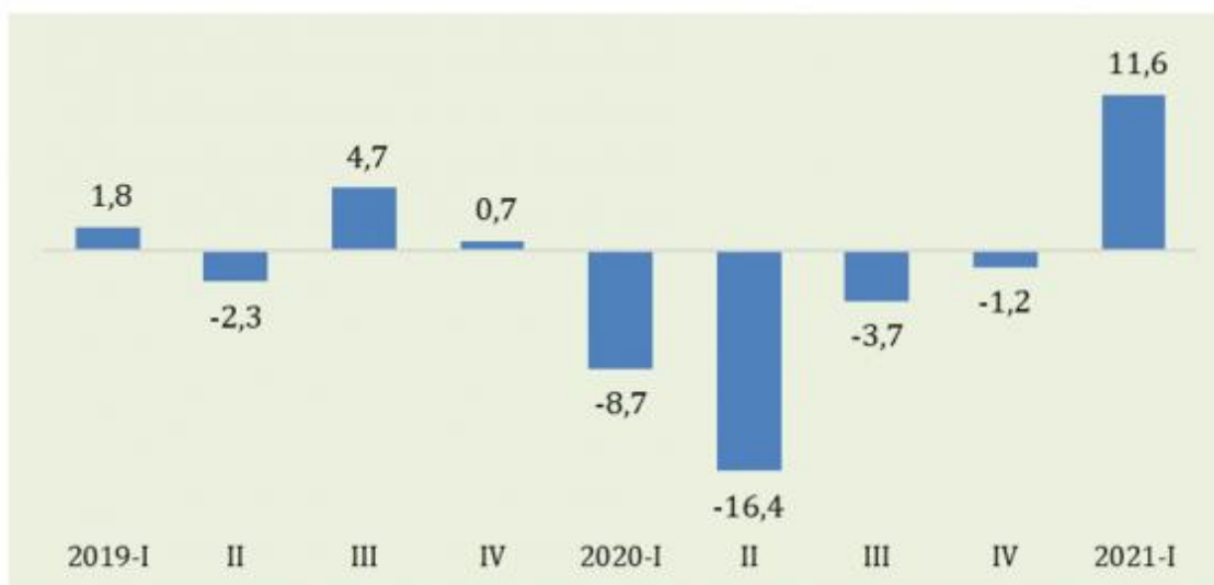
Evolución de la producción de Bienes de consumo, 2019-2021 (Var. %)

Lima, 10 de junio de 2021.- La Sociedad Nacional de Industrias (SNI) informó que la producción de bienes de consumo creció 11,6% en el primer trimestre del 2021 en comparación al mismo periodo del año anterior. Este resultado ha añadido 4,3 puntos porcentuales al crecimiento de la manufactura, que escaló 16,1% en los tres primeros meses de este año. El avance de la industria nacional también se logró por la contribución de otros productos industriales (bienes insumos y de capital), que han situado a la manufactura como el segundo sector de mayor aporte a la economía nacional durante este periodo.